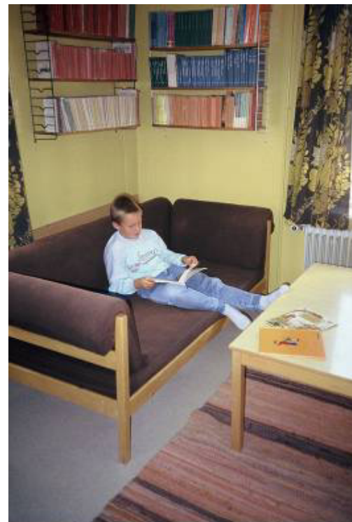
In der Lesecke;