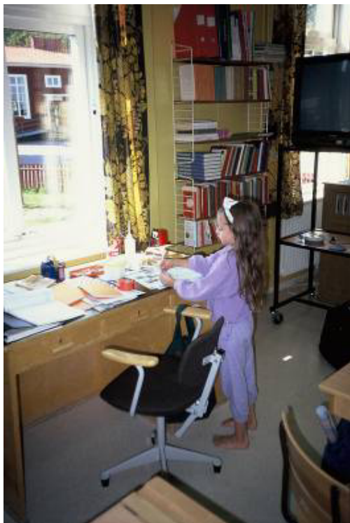
In der Bastecke

Lesecke mit Couch und Bücherregal, Freiräume mit Tischchen überall im Klassenzimmer, Tonzeichenpapier, Scheren, Kleber, Bücher für Projektarbeiten. Beeindruckend auf jeden Fall die lockere und muntere Atmosphäre im Klassenzimmer.