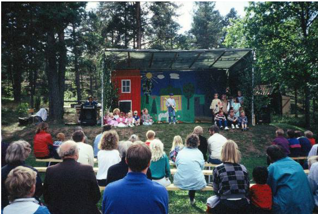
Beim Schulfest; Die Theatergruppe spielt „Michel von Lönneberga“

Am nächsten Tag, einem Samstag, gab es ein Schulfest. Wir wurden sogleich eingeladen und genossen den Nachmittag bei Spiel und Tanz, bei Essen und Trinken. Die Schultheatergruppe hatte ein paar Stücke eingeübt und führte diese nun vor. Zu unserer großen Freude waren Michel aus Lönneberga darunter sowie Pippi Langstrumpf!