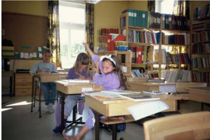
Kinder in einem schwedischen Klassenzimmer

Unsere Kinder waren natürlich auch neugierig, wie es in einer schwedischen Schule von innen aussieht. Ist sie anders als eine deutsche Schule? Ist sie so, wie Astrid Lindgren sie durch Pippi beschreibt? Trifft man dort Kinder wie Lisa, Michel oder Pippi?